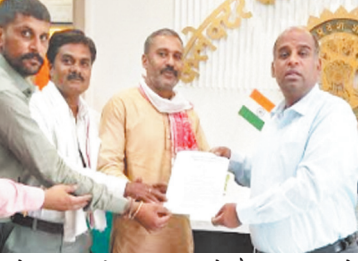
को समाप्त करने का अधिकार हो मौजूद कानून में आवश्यक संशोधन किया जाए ताकि कड़ई से पालन हो और उल्लंघन पर कड़ी सजा दी जाए भ्रमक एमआरपी के कारण उपभोक्ताओं के

के वित्त मंत्रालय वाणिज्य एवं उद्योग मंत्रालय और उपभोक्ता मामलों के संचालन के माध्यम से ऐसा कानून बनाया जाए जो एमआरपी को उपभोक्ताओं के लिए अधिक सार्थक और लाभकारी बनाएँ एक स्वतंत्र प्राधिकरण एवं बोर्ड या आयोग का गठन किया जाए जिसके पास नियम के तहत आदेश जारी करने और अधिक मूल्य के प्रतिकूल प्रभावों