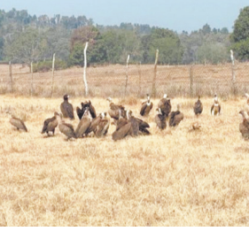
के 50 घोंसेले भी चिह्नित किए गए थे। गिद्ध गणना का कार्य गिद्ध आंकलन एवं संरक्षण हेतु विकसित डिजिटल मोबाइल एप 'गरुड' के माध्यम से किया जाएगा। इसके साथ ही प्रचलित प्रपत्रों के जरिए भी फील्ड स्टाफ द्वारा निर्धारित तिथियों में डाटा प्रविष्टि की जाएगी। इस उद्देश्य से कान्हा प्रबंधन द्वारा संबंधित फील्ड स्टाफ को प्रशिक्षण दिया जा रहा है। भारत में गिद्धों की कुल 9 प्रजातियां पाई जाती हैं, जिनमें अधिकांश तुलुप्रयाय श्रेणी में शामिल

मण्डला। मध्यप्रदेश वन विभाग द्वारा प्रदेशव्यापी ग्रीष्मकालीन गिद्ध गणना 22 से 24 मई 2026 के मध्य आयोजित की जाएगी। इस संबंध में 14 मई 2026 को प्रधान मुख्य वन संरक्षक (वन्यजीव), मध्यप्रदेश द्वारा वीडियो कॉन्फ्रेंसिंग के माध्यम से कार्यशाला आयोजित कर वन विभाग के अधिकारियों को आवश्यक दिशा-निर्देश एवं प्रशिक्षण प्रदान किया गया। इसी क्रम में कान्हा टाइगर रिजर्व अंतर्गत कोर, बाबर वनमंडल एवं फैन अभयारण्य के सभी 13 वन पक्षेत्रों में गिद्ध गणना का कार्य संचालित किया जाएगा। उल्लेखनीय है कि इससे पूर्व फरवरी 2026 में 20 से 22 फरवरी के मध्य आयोजित शीतकालीन गिद्ध गणना में कान्हा, किसली एवं सरही वन पक्षेत्रों में कुल 224 गिद्ध दर्ज किए गए थे। साथ ही वृक्षों पर गिद्धों