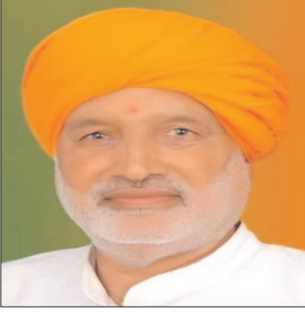
बजट-भाषण में घोषणा की थी कि किसानों को एक्सपोजर विजिट पर भेजा जाएगा। इसी घोषणा को मूर्तरूप देने की प्रक्रिया शुरू कर दी गई है। उन्होंने जानकारी दी कि इन कृषि-यात्राओं के दौरान हरियाणा के किसानों को गुजरात, महाराष्ट्र, मध्य प्रदेश, राजस्थान और तेलंगाना जैसे कृषि प्रधान राज्यों में जाने

समय जगत, चंडीगढ़। हरियाणा के कृषि एवं किसान कल्याण मंत्री श्री श्याम सिंह राणा ने राज्य के किसानों को आय बटने और उन्हें तकनीकी रूप से सशक्त बनाने के लिए एक महत्वपूर्ण योजना की शुरुआत की है। सरकार ने निर्णय लिया है कि प्रदेश के हर जिले से प्रगतिशील किसानों को चक्रसपोजर विजिट (अध्ययन यात्रा) पर भेजा जाएगा। इस पहल का मुख्य उद्देश्य राज्य के किसानों को देश के विभिन्न हिस्सों में अपनाई जा रही आधुनिकतम कृषि तकनीकों, उन्नत पद्धतियों और नए उभरते बाजारों से सीधा जुड़ाव प्रदान करना है, ताकि वे अपनी पारंपरिक खेती में सकारात्मक बदलाव ला सकें। इससे राज्य के हजारों किसान राष्ट्रीय स्तर पर कृषि सुधारों का प्रत्यक्ष अनुभव ले सकेंगे। श्री श्याम सिंह राणा ने बताया कि किसान हितैषी सोच रखने वाले मुख्यमंत्री श्री नायब सिंह सैनी ने अपने