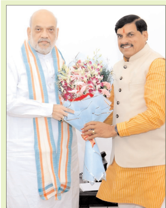
समय जगत, भोपाल। मुख्यमंत्री डॉ. मोहन यादव ने केंद्रीय गृह एवं सहकारिता मंत्री अमित शाह से नई दिल्ली में पुष्प-गुच्छ भेंट कर सौजन्य मुलाकात की।