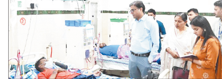
कलेक्टर ने नाराजगी व्यक्त करते हुए अनधिकृत लोगों के प्रवेश पर रोक लगाने के निर्देश दिए। साथ ही ड्यूटी पर तैनात कर्मचारियों के लिए शिफ्टवार रोस्टर तैयार करने को कहा, ताकि मरीजों को समय पर उपचार मिल सके और अनावश्यक प्रतीक्षा से बचा जा सके। निरीक्षण के दौरान कलेक्टर ने मरीजों और उनके परिजनों से सीधे संवाद कर उपचार व्यवस्था की वास्तविक स्थिति जानी। एक