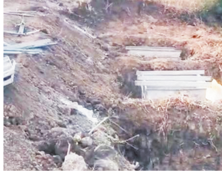
आर्थिक एवं मानसिक परेशानियों का सामना करना पड़ रहा है। किसानों ने चेतावनी दी कि यदि 15 जून 2026 तक नहर निर्माण कार्य पूर्ण कर पानी नहीं छोड़ा गया तो वे आंदोलन करने को मजबूर होंगे, जिसकी जिम्मेदारी शासन एवं प्रशासन की होगी। वहीं

समय जगत, खिरकिया। मुहाल माइजर नहर 1163 के निर्माण कार्य में हो रही देरी को लेकर क्षेत्र के किसानों ने अनुविभागीय अधिकारी राजस्व खिरकिया को ज्ञापन सौंपकर 15 जून 2026 तक कार्य पूर्ण कर नहर में पानी छोड़े जाने की मांग की है। ज्ञापन ग्राम मुहाल कलां, मुहाल खुर्द, कुडवा, पीपल्या भारत सहित आसपास के गांवों के किसानों एवं हितग्राहियों द्वारा दिया गया। किसानों का कहना है कि करीब 12 से 15 वर्ष पूर्व अस्तिचित भूमि को सिंचाई सुविधा उपलब्ध कराने के उद्देश्य से मुहाल माइजर नहर 1163 को स्वीकृति मिली थी। निर्माण कार्य का ठेका दिए जाने के बावजूद अब तक नहर पूर्ण नहीं हो सकी है। किसानों ने आरोप लगाया कि कई बार शासन एवं संबंधित विभाग को ज्ञापन देने के बाद भी कार्य में तेजी नहीं आई, जिससे क्षेत्र के किसान योजना के लाभ से वंचित हैं। ज्ञापन में किसानों ने बताया कि समय पर सिंचाई सुविधा नहीं मिलने से उन्हें