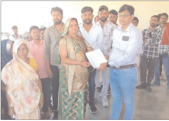
लड़ाई झगड़ा एवं अत्यधिक शराब के सेवन से एक व्यक्ति की मौत भी हो चुकी है। गांव के

समय जगत, पन्ना। मध्य प्रदेश शासन द्वारा आबकारी नीति में बदलाव करते हुए पूरे जिले का शराब ठेका एक ही ठेकेदार को सौंपा गया है। इसके साथ ही कुछ नगरीय क्षेत्रों की शराब दुकानें ग्रामीण क्षेत्रों में शिफ्ट की जा रही हैं जिसका विरोध होने लगा है। ऐसा ही मामला पन्ना जिले के बघवार कला का सामने आया है। ग्राम पंचायत बघवार कला की सैकड़ों महिलाओं और पुरुषों ने जिला मुख्यालय पहुंच कर कलेक्टर के विरोध प्रदर्शन और नारेबाजी करते हुए आबकारी अधिकारी कलेक्टर और पुलिस अधीक्षक के नाम आवेदन सौंप कर शराब ठेका ग्राम पंचायत बघवार कला से दूर खोलने की मांग उठाई है। ग्रामीणों ने बताया कि रेपु व मोहड़ा का शराब ठेका ग्राम बघवार कला में शिफ्ट किया जा रहा है। जहां पुलिस चौकी भी नहीं है। पूर्व में यहां शराब की वजह से यहां