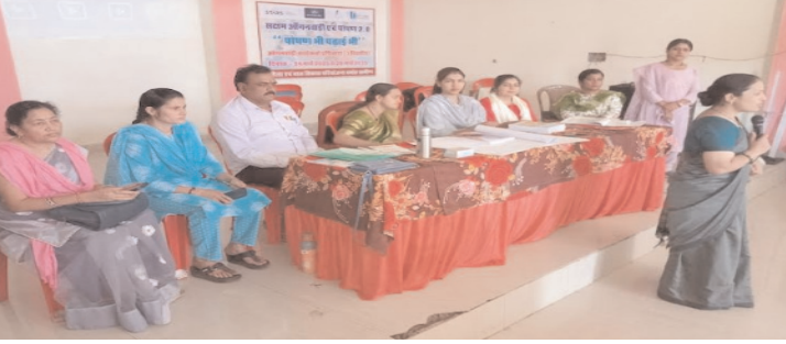
दिवस में प्रशिक्षण कार्यक्रम का आयोजन किया गया है। जिसमें पोषण व जीवन चक्र की महत्वपूर्ण दिवसों पर चर्चा कर आंगनवाड़ी कार्यकर्ताओं को प्रशिक्षित किया गया। इस अवसर पर प्रशिक्षण कार्यक्रम के सागर संचालक के

समय जगत, दमोह। जिले के दमोह परियोजना सभी आंगनवाड़ी कार्यकर्ताओं के लिए मास्टर ट्रेनिंग प्रशिक्षण दिया जा रहा है। जिसमें पीपीटी, प्रोजेक्टर और स्पीकर के माध्यम से कार्यकर्ताओं को प्रशिक्षित किया जा रहा है। शासन के निर्देशानुसार यह प्रशिक्षण विकासखंड स्तर पर आयोजित हो रहा है। 3 वर्ष की आयु तक बच्चे की मस्तिष्क का 80 प्रतिशत और 6 वर्ष तक 90 प्रतिशत मानसिक विकास हो जाता है। इसी को ध्यान में रखते हुए नव चेतना व आधारशिला का पाठ्यक्रम तैयार किया गया है। इसका उद्देश्य आंगनवाड़ी केंद्रों को सिर्फ पोषण आधार तक सीमित न रखते हुए बच्चों की बुनियादी शिक्षा पर भी ध्यान देना है। सक्षम आंगनवाड़ी एवं पोषण 2.0 के अंतर्गत पोषण भी पढ़ाई भी के द्वितीय